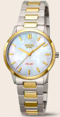
F 169 € SOLAR