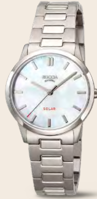
E 149 € SOLAR