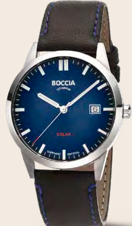
F 149 € SOLAR

A CHRONOGRAPH 3734-02 Titan, Saphirglas, Datum, 5 bar, Lederband, Ø 40 mm B CHRONOGRAPH 3736-02 Titan, Lünette Ceramic, Saphirglas, Datum, 5 bar, Titanband, Ø 39 mm C SOLAR CHRONOGRAPH 3735-01 Titan, Saphirglas, Datum, 5 bar, Lederband, Ø 40 mm D HERRENUHR 3672-01 Titan, Saphirglas, Datum, 10 bar, Titanband, Ø 39 mm E CERAMIC HERRENUHR 3675-02 Titan, Saphirglas, Datum, 5 bar, Titan/Ceramicband, Ø 39 mm F SOLAR HERRENUHR 3673-01 Titan, Saphirglas, Datum, 5 bar, Lederband, Ø 39 mm G CHRONOGRAPH 3733-01 Titan, Datum, 10 bar, Titanband, Ø 42 mm H CHRONOGRAPH 3733-03 Titan, Datum, 10 bar, Titanband, Ø 42 mm