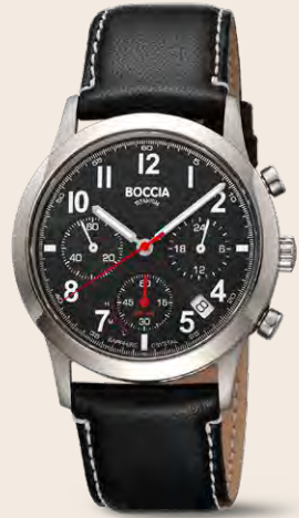
C 179 € SOLAR